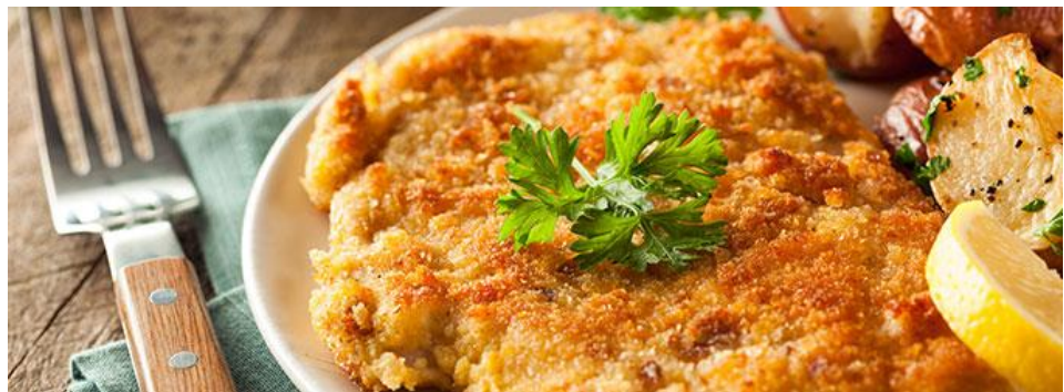
Schnitzel, Pommes, Pasta & Co. – für jeden Kindergeschmack etwas dabei