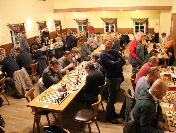
2019 war der Festsaal noch den Erwachsenen und älteren Jugendlichen vorbehalten.

Bereits die Kreisjugendeinzelmeisterschaft 2019 fand in Rohrbach statt. Seinerzeit wurden die Jugend- und Meisterklassen (Erwachsene) zeitgleich ausgetragen. Die älteren (U18-U14) durften schon damals im großen Festsaal spielen.