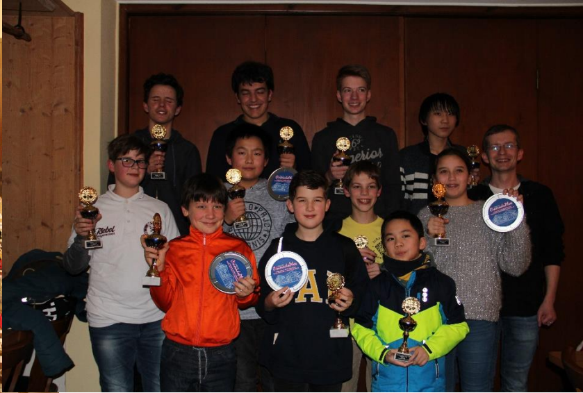
Stolz wie Oskar halten die Gewinner der Altersklassen Ihre Pokale und Preise (Kinogutscheine) in die Kamera.

Trotz widriger Witterungsverhältnisse kamen 62 Teilnehmer nach Rohrbach, 12x U16/U18, 12x U14, 21x U12 und 17x U10. Die amtierenden Jugendkreismeister (Bild rechts) können auf der Internetseite des Schachkreises eingesehen werden.